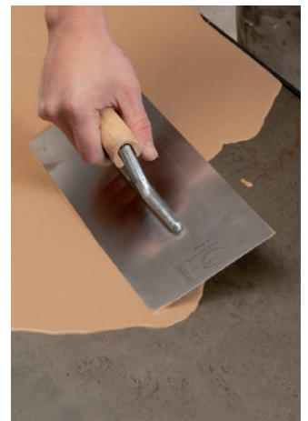
2. Schnellspachtelmasse SL 52 ist möglichst in einem Arbeitsgang bis zur gewünschten Schichtstärke auf den grundierten Untergrund aufzutragen.