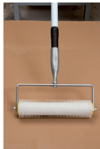
3. Um eine optimalen Verlauf zu gewährleisten, kann die Schnellspachtelmasse SL 52 mittels Stachelwalze entlüftet werden.