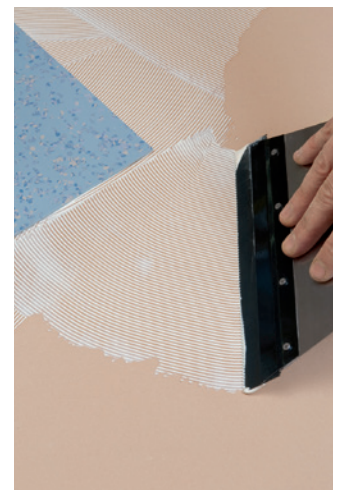
4. Mit dem Designbelagsklebstoff D 495 bzw. dem Spezial Haftbettklebstoff LF 300 verkleben Sie elastische und textile Bodenbeläge.