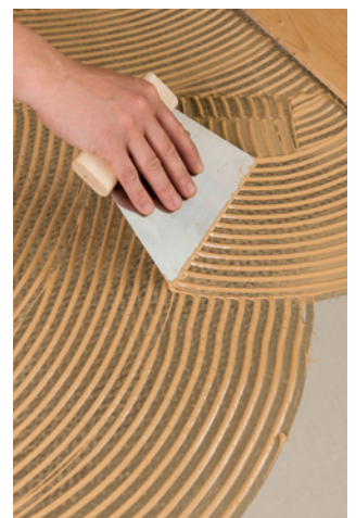
4. Mit dem Spezialklebstoff X-Bond MS-K88 , Parkettklebstoff X-Bond MS-K530 oder Parkettklebstoff X-Bond MS-K539 verkleben Sie alle Arten von Parkett und Holz.