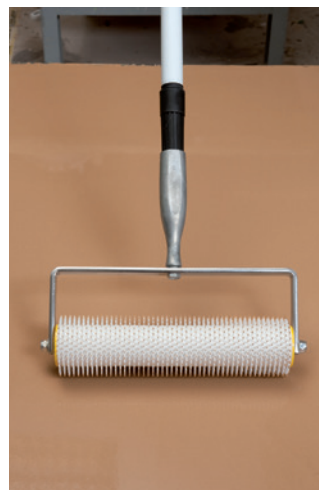
3. Um eine optimalen Verlauf zu gewährleisten, kann die Schnellspachtelmasse SL 52 mittels Stachelwalze entlüftet werden.