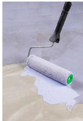
1. Spezial-Haftgrund DX 9 ist gleichmäßig auf saugende als auch nicht saugende Untergründe aufzutragen.